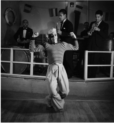
Le club Le Ponton 2 à Montparnasse, 1934