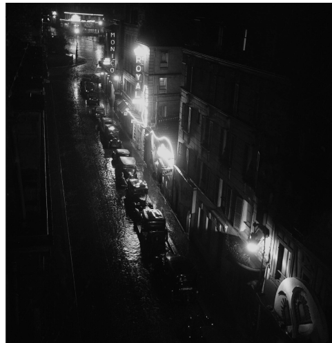
La rue Pigalle et ses boîtes de nuit, vers 1939