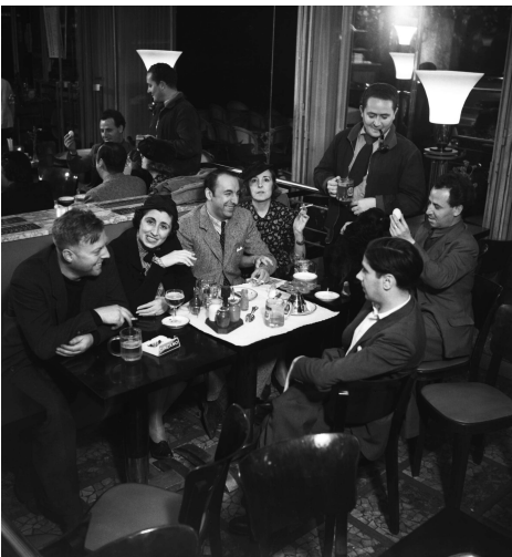
Le bar La Coupole à Montparnasse, vers 1939