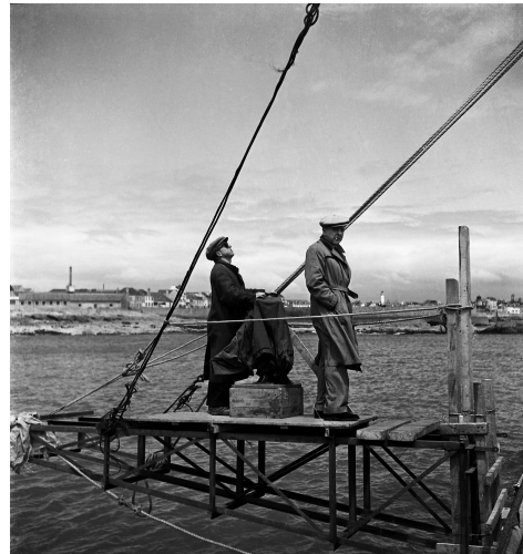
Marcel Carné et Jacques Prévert sur le tournage de La Fleur de l'âge , 1947