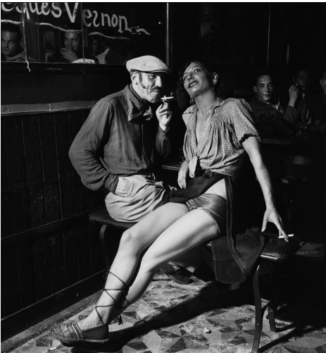
Dans un bar de Pigalle, un « apache » et sa protégée, 1938