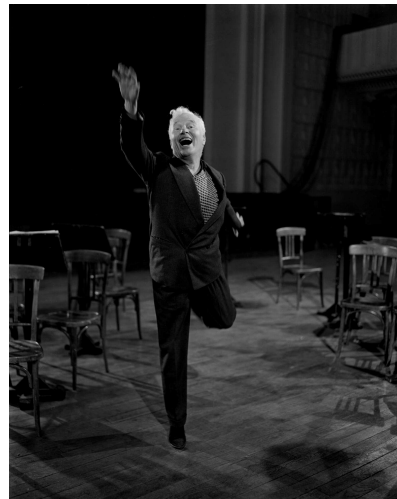
Charlie Chaplin à Paris, 1959