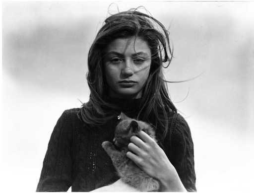
Anouk Aimée (Barbara) et son chat dans La Fleur de l'âge , 1947