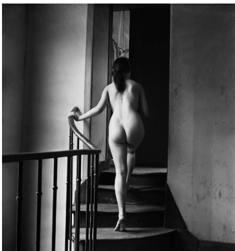
Nu à l'académie de la Grande Chaumière à Montparnasse, 1950-1951