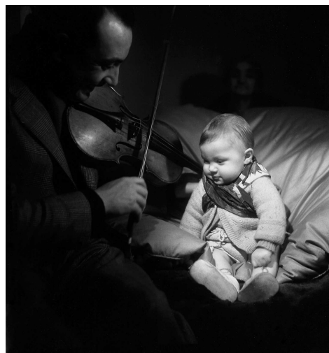
Django Reinhardt joue du violon à son fils Babik, vers 1945