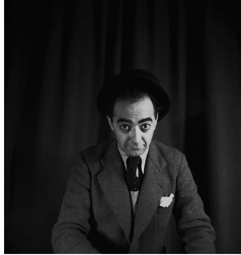
Gyula Halasz dit Brassai, 1935